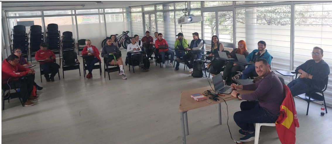
1. Imagen: Reunión sesión de la CLIP Ciudad Bolívar mes de Mayo del 2026