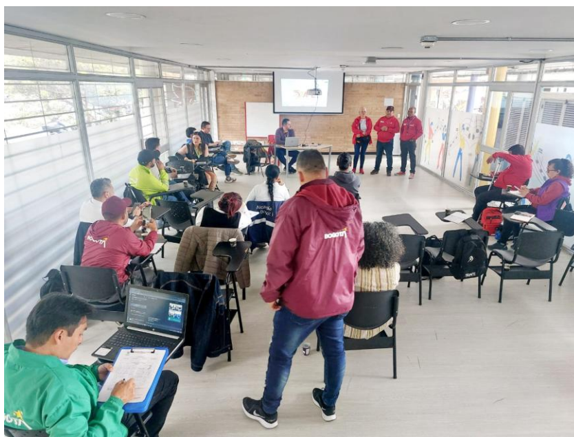
2. Imagen: Reunión sesión de la CLIP Ciudad Bolívar mes de Mayo del 2026